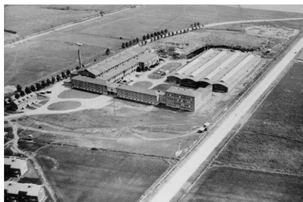
Daros i Partille, år 1950

Nu har vi gjutit bottenplattan för paviljongen som kommer vara mellan huset och P-huset. Pelare och bjälklagsplattor monteras och blir klart till semestern.